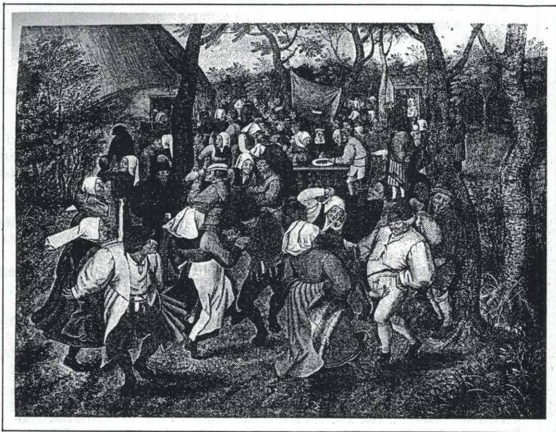
Schilderij "Boerenbruiloft" van Pieter Breughel.

Ze beperken zich in dergelijk geval niet tot de genodigden die met hen drinken, maar ze roepen de voorbijgangers aan, doen ze binnen komen en verplichten ze te drinken tot ze er bij op de grond rollen.