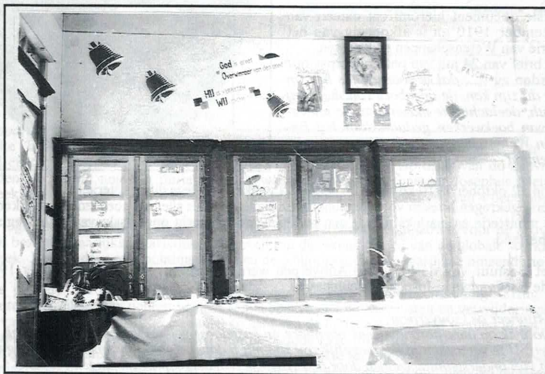
Zicht op de "Zaal der Maatschappelijk Werken" ter gelegenheid van een kajotterstentoonstelling. Bemerkt de met houten panelen afgedekte grote bibliotheekkasten tegen de wand.

In dit lokaal dat, volgens het verslag van de beheerraad van 29 september 1936, paalde aan andere lokalen die deel uitmaakten van de parochiale zaal, stonden enkele met houten panelen afgesloten hoge kasten waarin de boeken op schabben waren gerangschikt. Er was geen afzonderlijke leeszaal aan verbonden en de boeken dienden dus meegegeven met de ontleners. Teneinde toch wat schrijfruimte te hebben was de biljarttafel in het ontspanningsgedeelte met een houten plaat afgedekt.