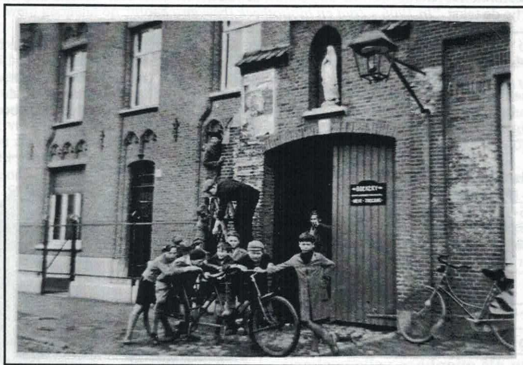
Inkompoort van de boekerij. Op de deurplaat: "Boekerij - Open 's zondags van 10 tot 12 u. - vrije toegang"