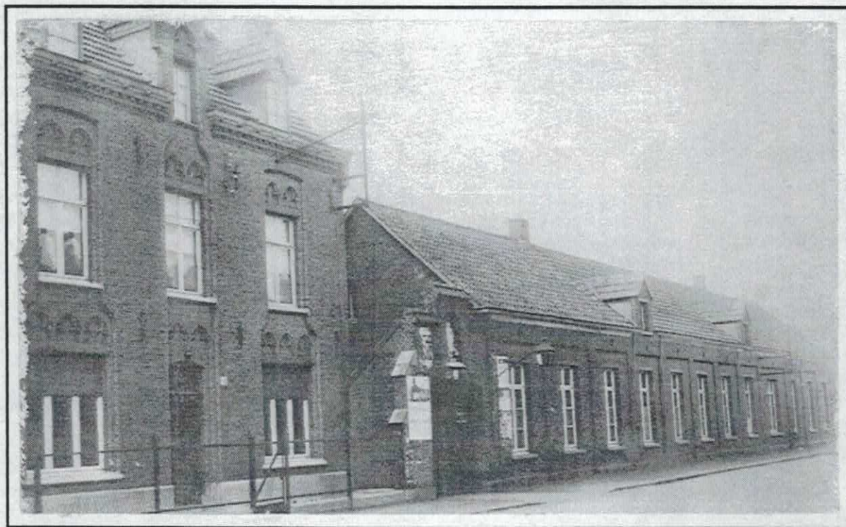
Links het kloostergebouw, rechts de bewaarschool met de bibliotheek, waarvan de ingang onder het Mariabeeld.

De oudst bewaarde statistische gegevens over de werking van de “Openbare volksboekery van de parochie Lint” (zo genoemd in een schrijven van het Ministerie van Wetenschappen en Kunsten van 12 oktober 1910), waren bestemd voor het provinciebestuur en tonen cijfergegevens over de werking tussen 1910 (laatste twee maanden) en 1913. Op een statistiek over het werkjaar 1923 komen wij iets meer te weten over het stichtingsjaar. Daarin werd zij vermeld als vrije parochiale boekery gevestigd in de zustersschool sinds 1907.