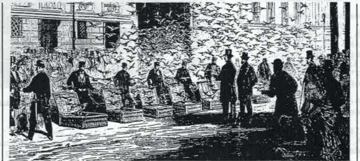
Het lossen der duiven in Parijs rond 1875.