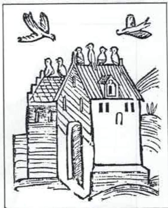
Duivenhok uit het begin van de 16de eeuw.

In heel wat pachtbrieven van die tijd zijn ook afspraken opgenomen waaraan pachter of eigenaar zich moeten houden in verband met bezit en onderhoud van de duiven en het duifhuis, evenals de bestemming van het vlees en de zo gegeerde mest.